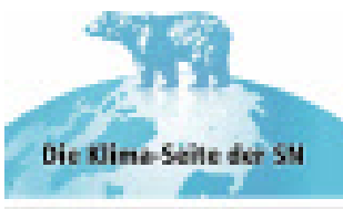
Die Klima-Seite der SN

Welzer: Aus analytischer Perspektive spricht alles dafür, dass die Zukunft wenig friedlich sein wird. Doch Katastrophen können verhindert werden, gerade weil Apokalyptiker vor ihnen frühzeitig warnen.