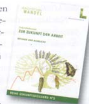
Agrarische Rundschau November 2010

Dass heute an die 70 Prozent der Beschäftigten in Österreich im Dienstleistungsbereich tätig sind, zeugt von diesem