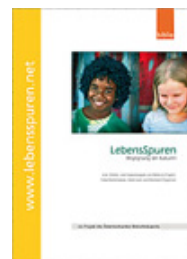
Biblios März 2010

Herausforderung Zukunft : der demografische Wandel - aktuelle Projekte vorgestellt von der Robert-Jungk-Bibliothek